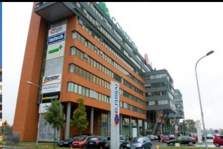
Mistral Office Building