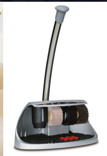
Cosmo 3 Plus

Heute Service sp. z o.o. ul. Wałowska 19A 02-451 Warszawa