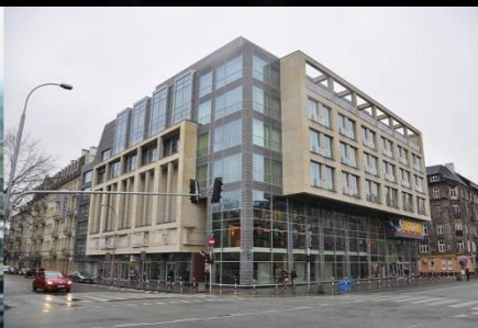
Nove Kino Praha