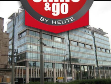
Prosta Office Center