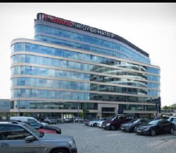
Libra Business Center